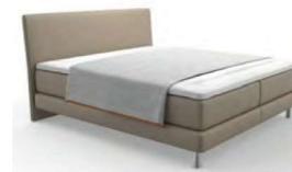
Typ 100 Plaid Klassik komplett geöffnet, deckt die Liegefläche nicht ab.

Bitte bei Bestellung (vor allem Einzel- oder Nachbestellung) immer die Bettmaße angeben. Die angegebenen Maße sind ca. Maße. Geringfügige Maßabweichungen zur Liegefläche plus Volanthöhe sind produktionsbedingt.