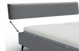
22924 / 22929 mit Kappnaht / bodenfrei Höhe 24 / 29 cm Kopfteil-Blende für Bettgestell 24 cm bzw. 29 cm Höhe