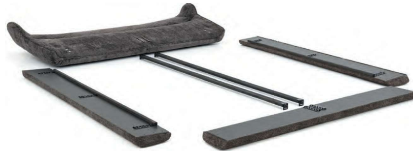
Bettgestell gepolstert • innen anthrazit • transportfreundlich zerlegt • variable Liegehöhe von ca. 7 cm durch seitliche Beschläge