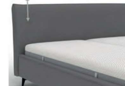
23903 Multimaß mit Biese Höhe 62-107 cm / bodenfrei in 5 cm-Schritten kürzbar