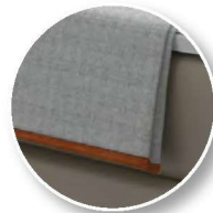
Typ 100 Plaid Klassik Kanten mit Einfassband paspeliert