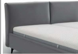
22944 mit Kappnaht Höhe 89 cm / bodenfrei