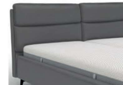
22990 mit Kappnaht Höhe 95 cm / bodenfrei nur lieferbar bei Bettgrößen 160/180/200 cm Breite