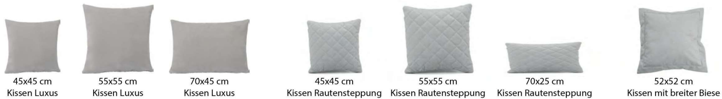
45x45 cm Kissen Luxus