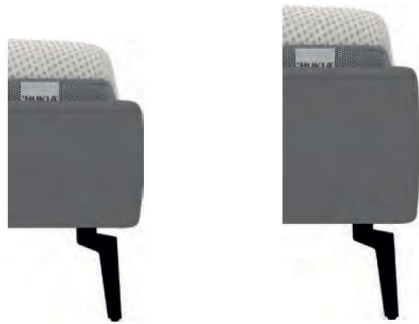
KU24 kubisch Höhe ca. 24 cm

Nahtoptik wird immer dem ausgewählten Kopfteil angepasst