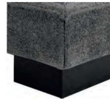
S901-13 S901-18 Sockel schwarz gegen Aufpreis