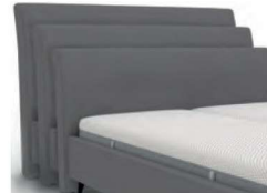
↳ 22968S - Höhe 99 cm ↳ 22968M - Höhe 109 cm ↳ 22968L - Höhe 119 cm mit Kappnaht / bodennah