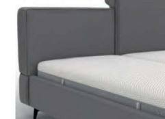
22994KV mit Kappnaht/ Höhe 91 cm / bodenfrei nur lieferbar bei Bettgrößen 160/180/200 cm Breite