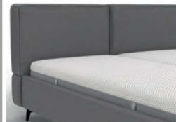
22994 mit Kappnaht Höhe 91 cm / bodenfrei nur lieferbar bei Bettgrößen 160/180/200 cm Breite